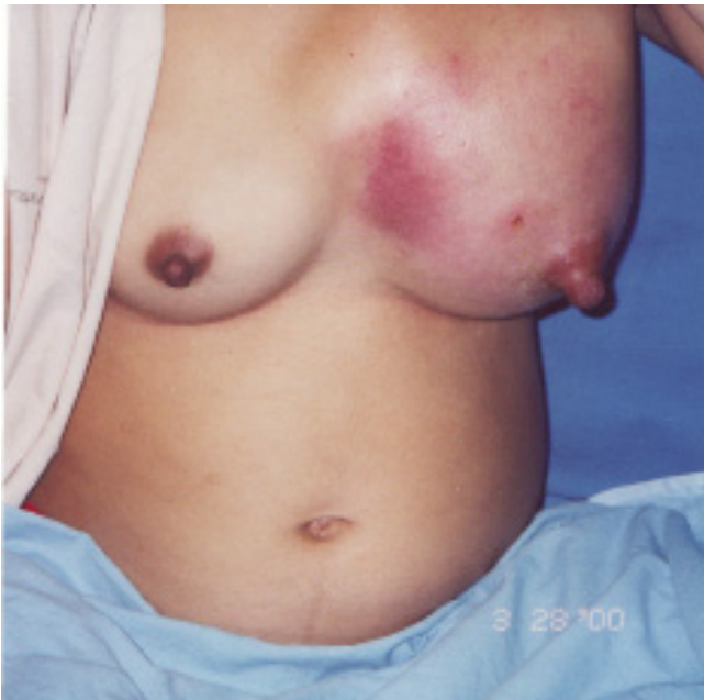
Figura 1 - Aspecto clínico da tumoração inflamatória expansiva. Quadrante superior e medial da mama esquerda e região esternal.